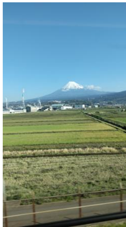
復路 富士山見えました