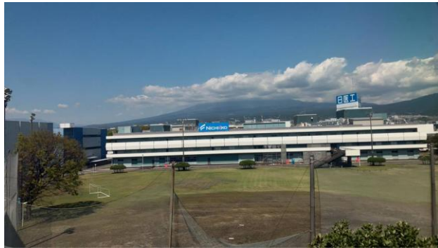
往路 富士山が見えません